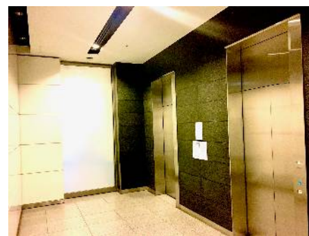
エレベーターホール