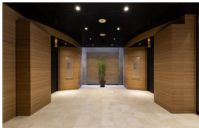
1階エレベーターホール