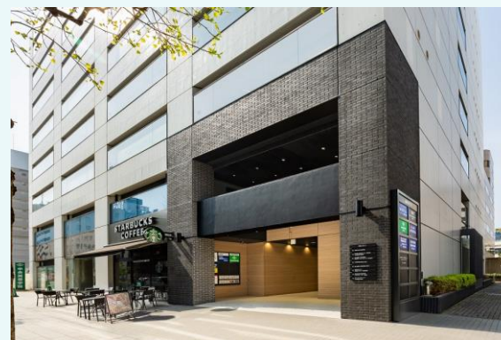
1階エントランス外観