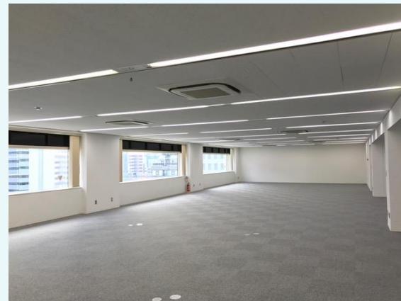
貸室内イメージ（他フロア・他区画の写真）