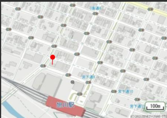
JR函館本線「旭川駅」 徒歩2分