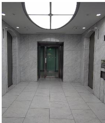
エレベーターホール