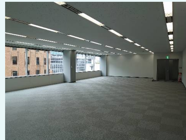
室内参考写真 ※こちらは49.44坪の区画です。