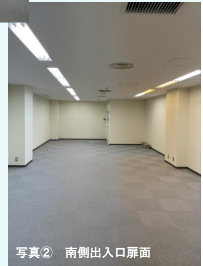
写真② 南側出入口扉面