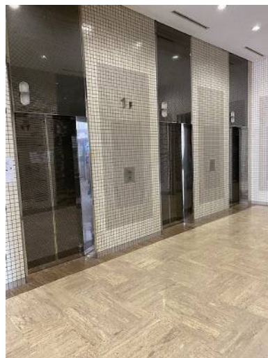
1階エレベーターホール