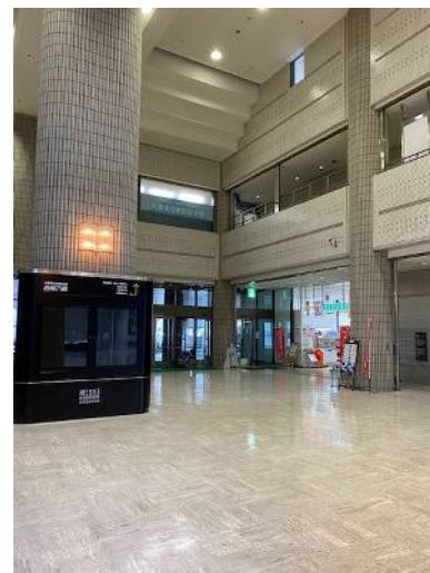
1階エントランス (コンビニ有り)