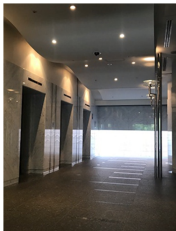
地上1階エレベーターホール