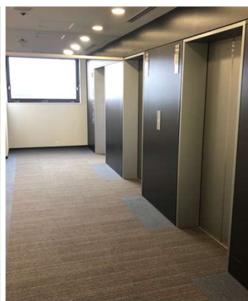
基準階エレベータホール