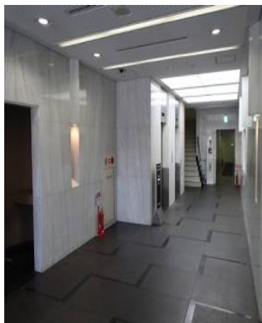
1階エレベーターホール