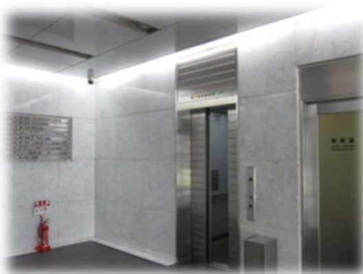
エレベーターホール