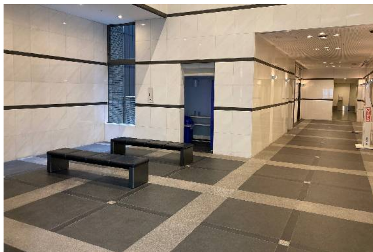
ロビー及びエレベーターホール