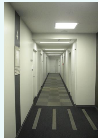
基準階エレベータフロア