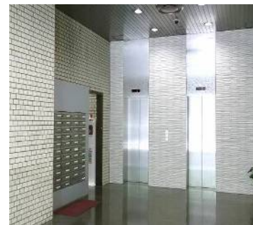
エレベーターホール