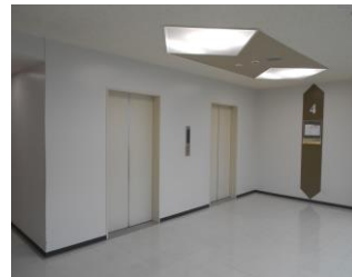
各階エレベーターホール