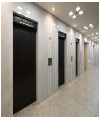
エレベーターホール (1階)