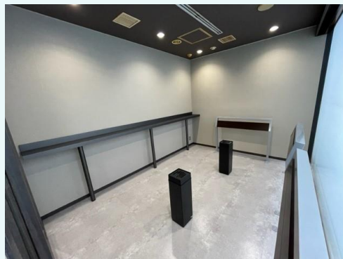
喫煙所（2023年2月にリニューアル）