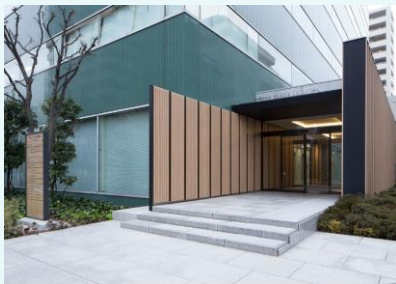
正面エントランス