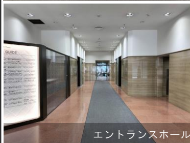
エントランスホール