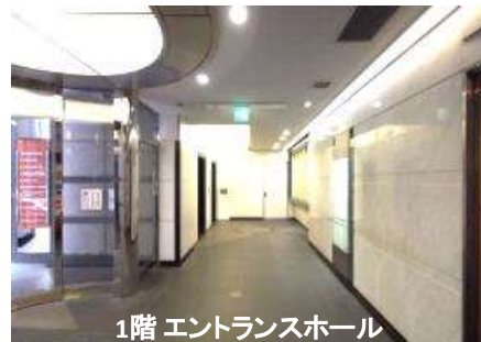
1階 エントランスホール