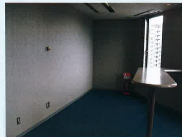
リフレッシュコーナー