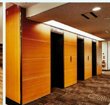
地下1階リフレッシュルーム