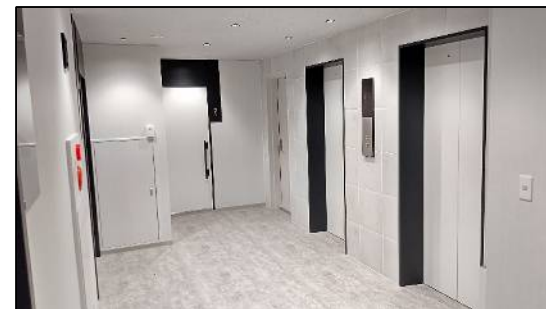
6階エレベーターホール