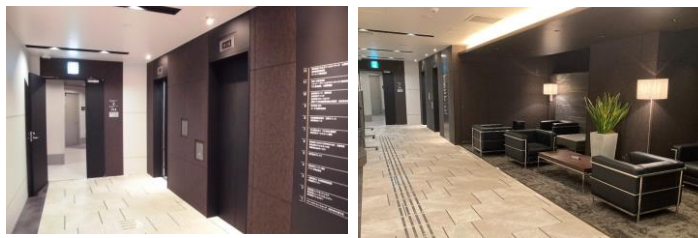
エレベーターホール