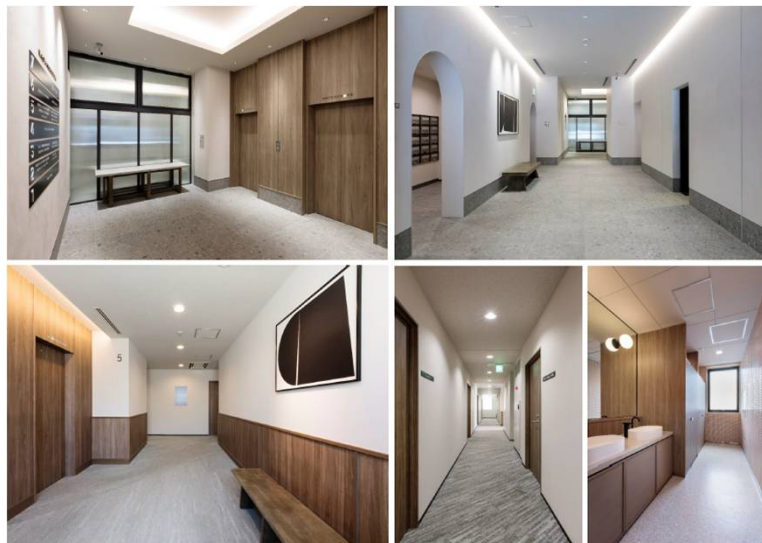
エントランス・エレベーターホール・共用部