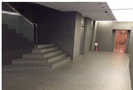
1階 エレベーターホール