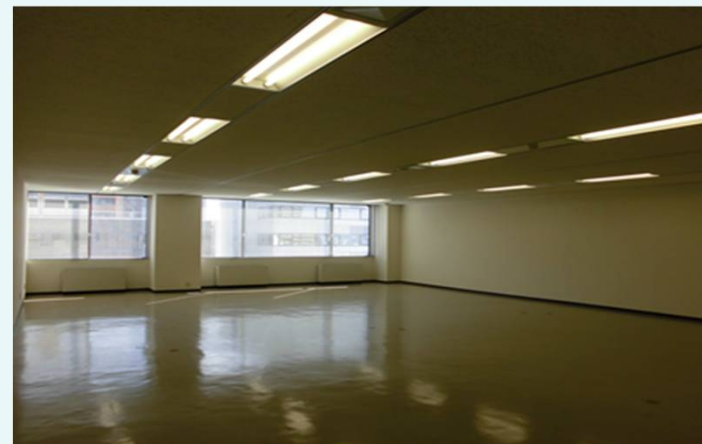
5階 (121.50㎡) 貸室