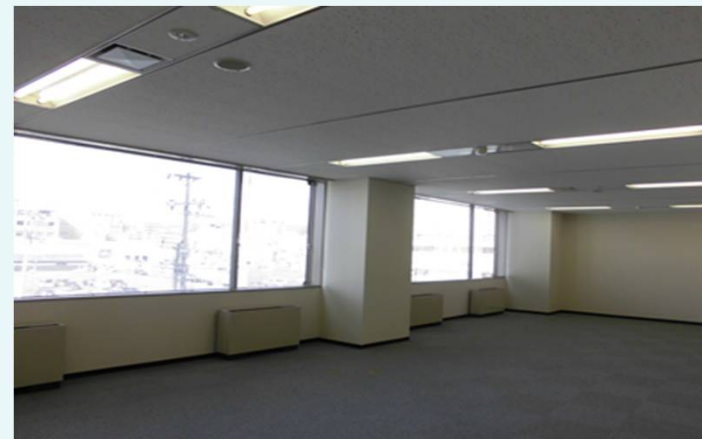
3階 (66.03㎡) 貸室