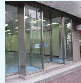
1F 募集区画正面入口・突出看板 袖看板