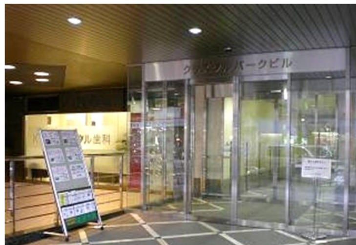
正面エントランス