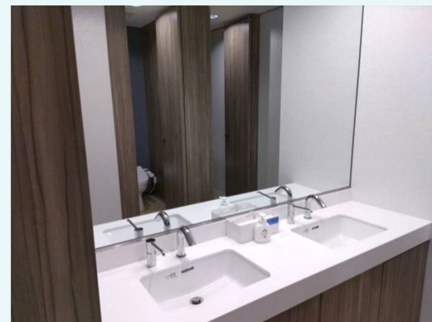
8階トイレ（2022年リニューアル済） ※内装、洗面台、小便器、大便器、照明のフルリニューアル