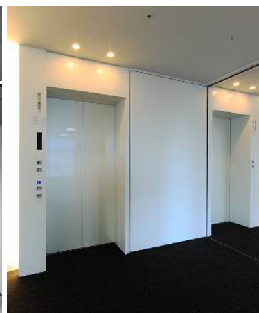
基準階エレベータホール