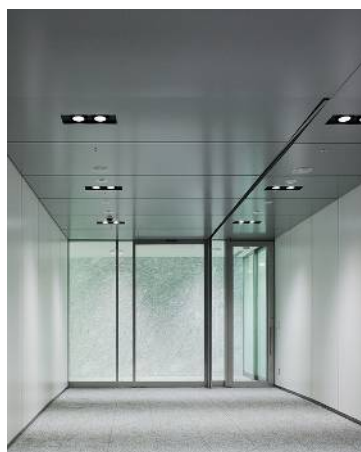
メインエントランス