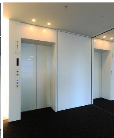
基準階エレベータホール