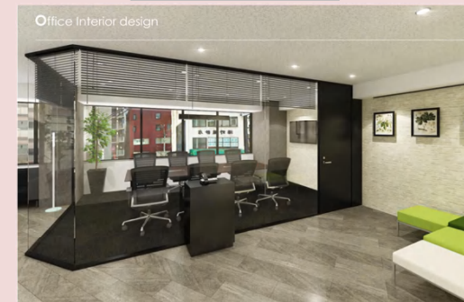
ガラス張り会議室